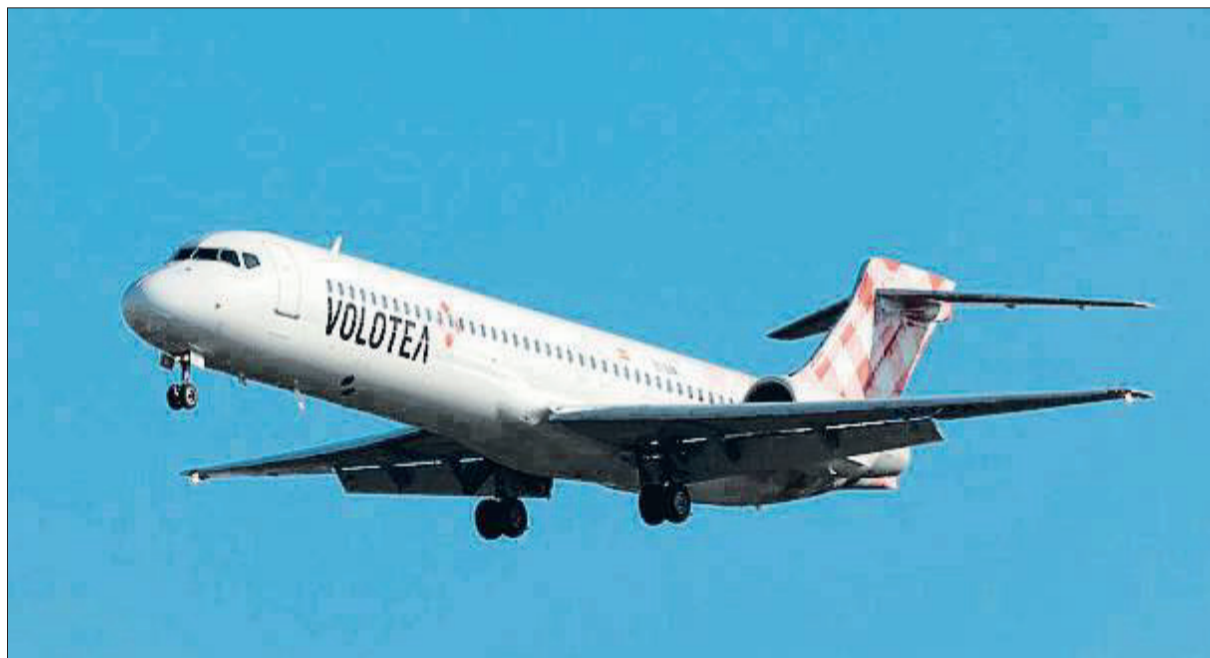
La aerolínea de bajo coste Volotea empezó a volar hace seis años

Tras elegir a los dos ganadores —que se impusieron, en la puja final, a otro fondo, Indigo Partners—, la compañía y los asesores de todos los fondos involucrados